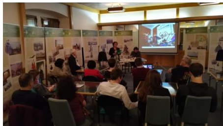
Február 22./ Évzáró gyűlés és kiállításmegnyitó